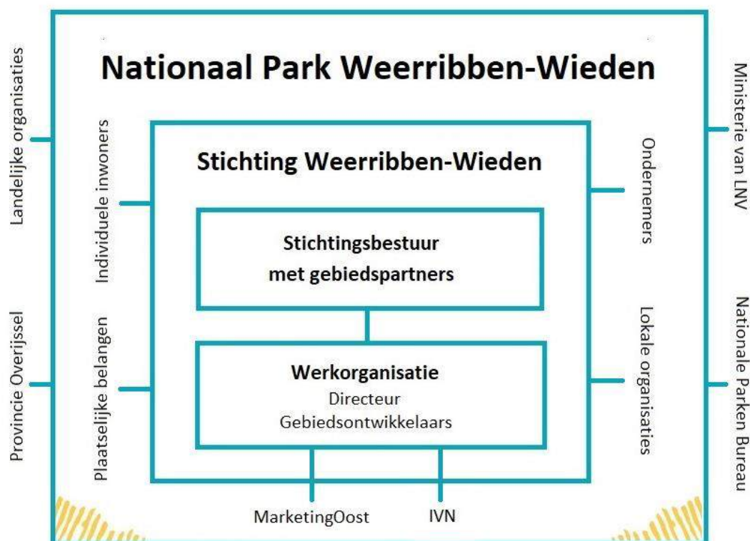
Figuur 2: Belangenveld van NP Weerribben-Wieden. In het midden staat Stichting Weerribben-Wieden, met daaromheen stakeholders binnen en buiten het Nationaal Park waarmee de samenwerking wordt gezocht.

We hebben een kleine, maar sterke organisatie nodig om onze rol in te kunnen vullen. In 2021 is er een kernteam Stichting Wieden-Weerribben opgebouwd: een directeur en een aantal gebiedsontwikkelaars, zowel met expertise in natuur en landbouw als met expertise in toerisme en erfgoed. Expertise op gebied van marketing, educatie en communicatie komt momenteel van IVN Natureducatie en MarketingOost. Er is de wens om in de nabije toekomst ook een communicatiemedewerker in te huren. De uitvoerders van IVN en MarketingOost zijn erg nauw betrokken bij de werkorganisatie. De werkorganisatie neemt de rol van gebiedsaanjager en -ontwikkelaar en gebiedspromotor op zich.